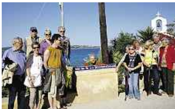
Ein Teil der Uferpromenade wurde jetzt in »Susanne-Jäger-Weg« umbenannt.

Nach ihrem überraschenden Tod wurde im Jahre 2009 überlegt, sie mit einer Straßenbenennung zu ehren. Die stellvertretende Bürgermeisterin der Insel sorgte für