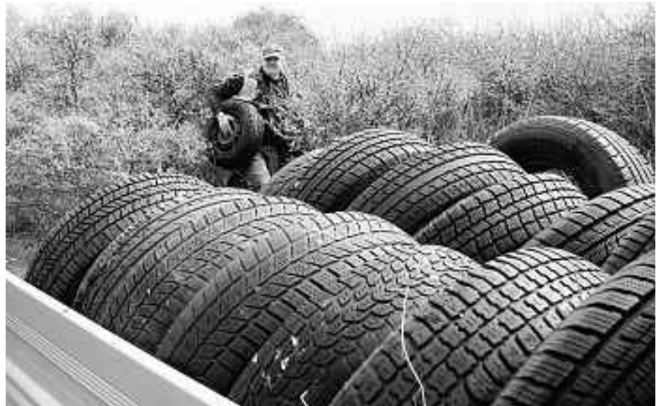
Eine ganze Ladefläche voller Altreifen sammelte Edgar Schuck ein.

Die Gemeindeverwaltung schätzt die Gesamtaufwendungen insgesamt auf rund 35 000 Euro pro Jahr. Neben einer Verschmutzung und Belastung der Landschaft bringt illegaler Müll im Übrigen große Gefahren mit sich. Dass ein solcher Reifenstapel, wie er jetzt in Bodenheim