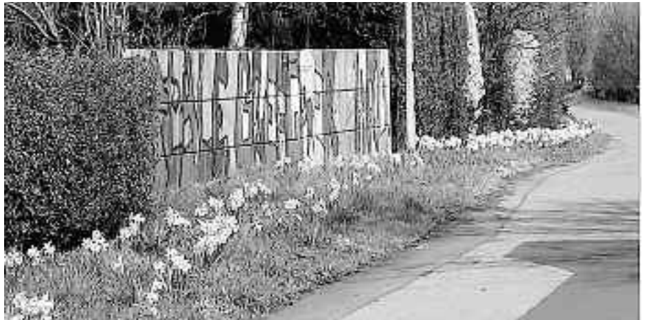
Die blühenden Narzissen erfreuen das Auge der Friedhofsbesucher.

Der Arbeit dieser Aktiven ist es zu verdanken, dass manche „langweilige“ Ecke heute zu einem ansehnlichen Schmuckstück geworden ist.