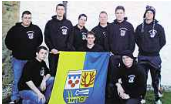
Die Jungesellen wollen das Brauchtum pflegen.